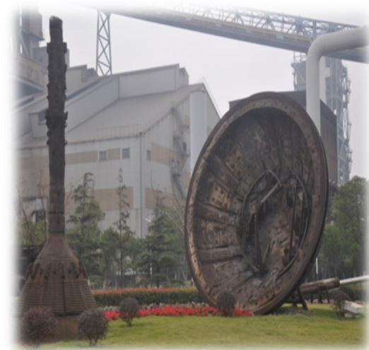
——冶金学院2011级钢冶宝钢实习简报