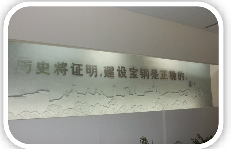
参观宝钢历史博物馆

传承经典工艺，构建完美蓝图，秉承富强之道，开拓先进思维，建设创新人才，将企业在全球屹立不倒之位，优秀的管理，高质量的产品，打造中国最强钢铁企业。宝钢，以她的自身文化魅力，创作了不一样的工业奇迹。