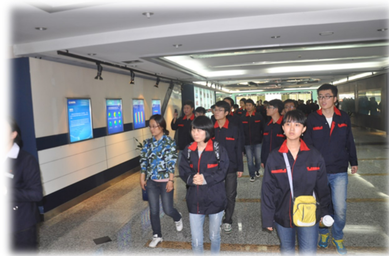
参观宝钢产品展览馆